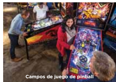
Campos de juego de pinball

¡El museo sorprende a grupos y a viajeros independientes con una experiencia única! Incluya una parada en The Strong, la mayor atracción cultural del oeste de Nueva York, y explore dos pisos de espacios de exposiciones dinámicas de más de una cuadra de largo. Descubra la colección de juguetes, muñecas y juegos más grande del mundo; pruebe sus habilidades en las clásicas máquinas de videojuegos; salte al mundo de los héroes de historietas estadounidenses; juegue en las máquinas de pinball clásicas; camine con cientos de mariposas que vuelan al aire libre; ¡todo eso y mucho más!