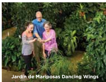
Jardín de Mariposas Dancing Wings