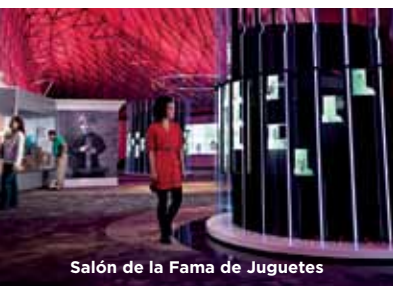
Salón de la Fama de Juguetes