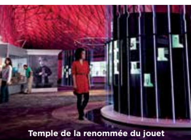
Temple de la renommée du jouet