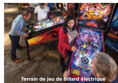
Terrain de jeu de billard électrique

Épatez des groupes et des voyageurs solitaires avec une expérience muséale unique! N'oubliez pas une visite au The Strong — la plus grande attraction culturelle de l'ouest de l'État de New York — et explorez deux étages d'expositions amusantes sur plus d'un quadrilatère. Découvrez la plus grande collection au monde de jouets, de poupées et de jeux; comparez vos habiletés sur de vieux classiques de l'arcade, plongez dans le monde des héros de bande dessinée américaine; jouez sur une machine rétro de billard électronique d'arcade; marchez au milieu de centaines de papillons et plus encore! Situé dans la région de Rochester Finger Lakes de New York, le musée est facilement accessible depuis Niagara Falls et d'autres destinations canadiennes et américaines.