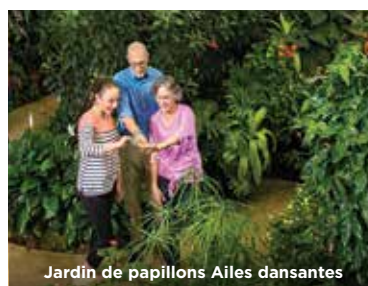
Jardin de papillons Ailes dansantes